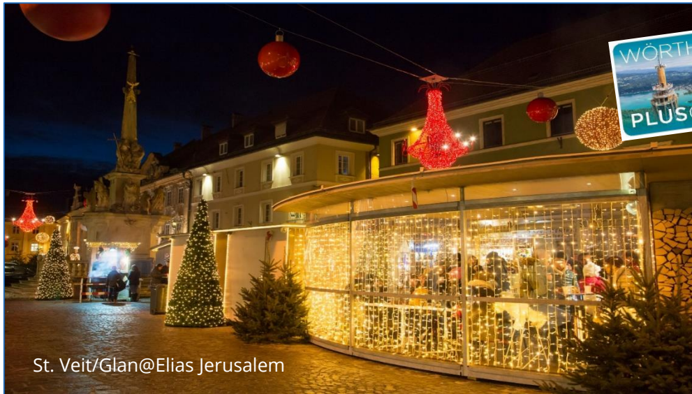
St. Veit/Glan

Erleben Sie die abendliche Herzogsstadt St. Veit an der Glan und erfahren Sie bei einem Spaziergang Spannendes und Kurioses über Persönlichkeiten und Begebenheiten aus vergangenen Zeiten.