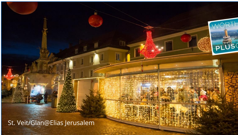
St. Veit/Glan@Elias Jerusalem

Erleben Sie die abendliche Herzogsstadt St. Veit an der Glan und erfahren Sie bei einem Spaziergang Spannendes und Kurioses über Persönlichkeiten und Begebenheiten aus vergangenen Zeiten