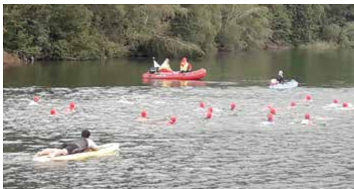
Überwachung Kraigersee Triathlon