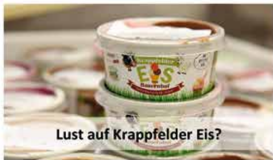
Lust auf Krappfelder Eis?