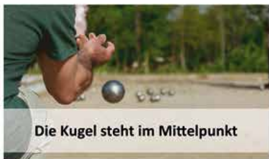
Die Kugel steht im Mittelpunkt