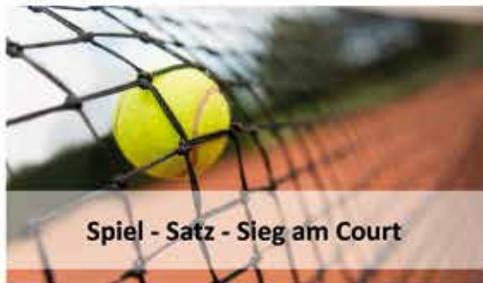
Spiel - Satz - Sieg am Court